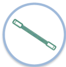
Acclaim RSLC 120 Acclaim PepMap